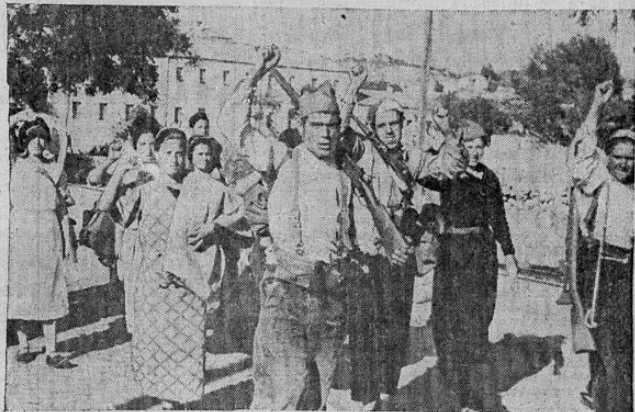
Marchando hacia el frente en la Sierra de Guadarrama, puede verse aquí un pelotón de los abrigadas milicias obreras del gobierno. Las mujeres siguen sus maridos hacia el campo de batalla. Todos dan el saludo comunista al fotógrafo.

Comenzó el bombardeo aéreo sobre San Sebastián